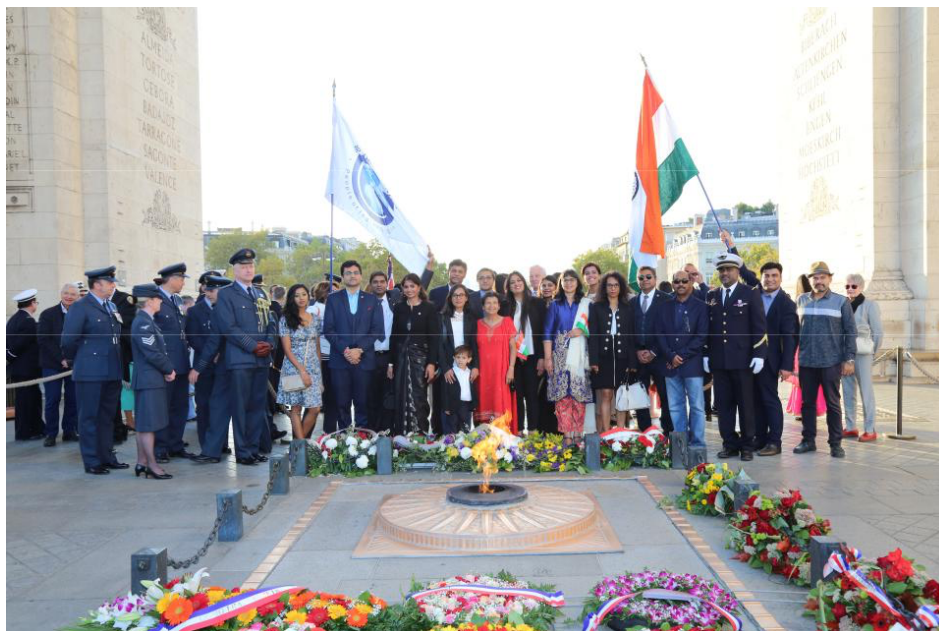
GOPIO FRANCE METROPOLE : Cérémonie de ravivage de la flamme de la nation en mémoire des soldats indiens qui sont morts pour la France pendant la grande guerre, l'arc de triomphe, Paris le 15/09/2018.

Activité associative : - Active et disponible pour aider les femmes en détresse de la communauté Indienne de Paris, Elle milite activement pour les droits de femmes auprès de la représentation Indienne à Paris ; Elle est aussi la première vice-présidente de l'association "GOPIO FRANCE METROPOLE" l'association représentant le diaspora Indienne de France.