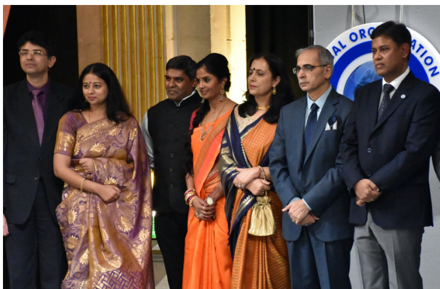
Célébration de la fête des lumières « Diwali » à l'Hôtel de Ville de Paris en compagnie de l'ambassadeur de l'Inde en France.