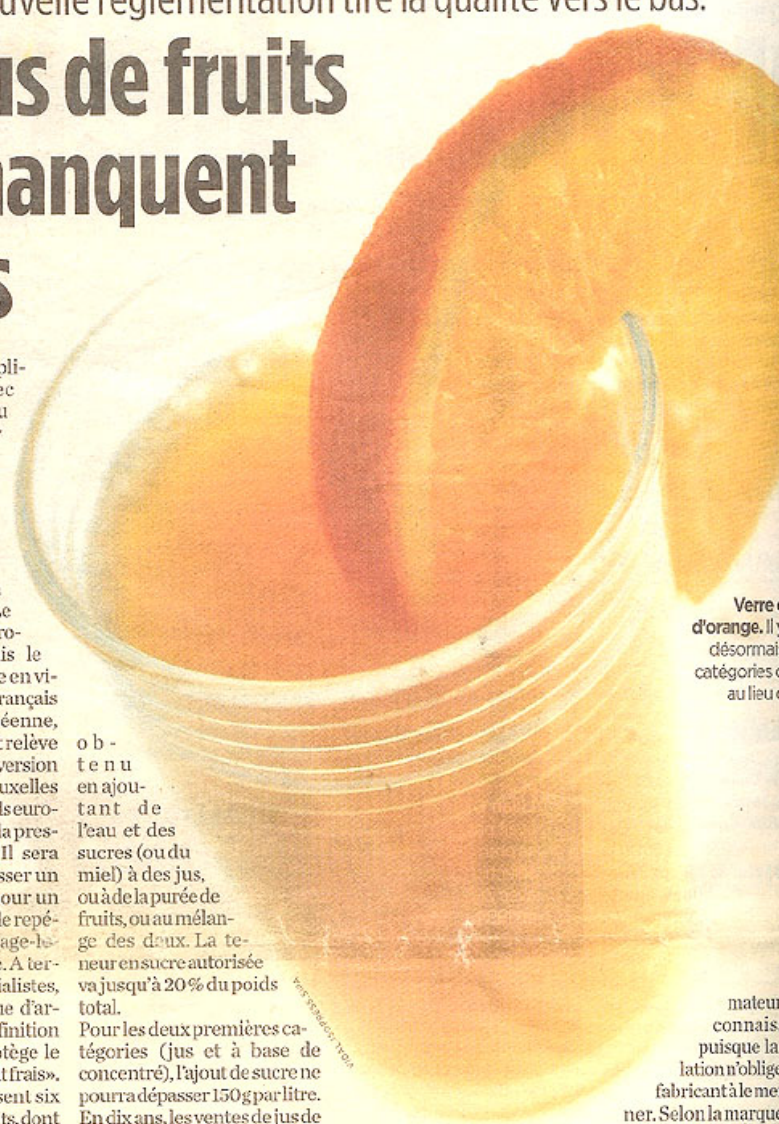
Verre d'orange. Il y a désormais deux catégories de jus au lieu d'une.

mateur connaît puisque la réglementation n'oblige pas le fabricant à le mentionner. Selon la marque, les attentes supposées des consommateurs (les enfants notamment) pourront le rendre plus acide, tendre, et moins sucré. L'Unijus (Union interprofessionnelle des jus de fruits) a obtenu de pouvoir conserver son label «100% pur jus» désormais sans valeur légale. L'assurance que ses adhérents tiendront aux anciens consommateurs. Comme on dit à l'heure des promesses n'engageant pas ceux qui y croient. Après lecture attentive des pages consacrées au